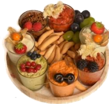
Apero dip bar