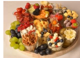
Luxe Apero bord groot